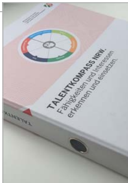
Abb. 1: TalentKompass-Ordner

unterschiedliche Themen oder Tätigkeitsfelder, die sich an den persönlichen Interessen der jeweiligen Person ausrichten.