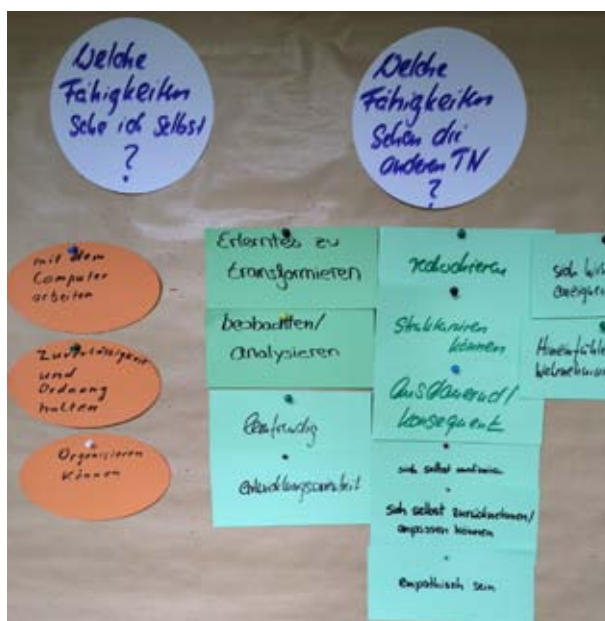
Abb. 3: Auswertung positiver Bericht

Der TalentKompass geht davon aus, dass Menschen die höchste intrinsische Motivation entwickeln, wenn sie mit ihrem favorisierten Fähigkeiten in ihrem Interessensgebiet einen Beitrag zu den persönlich wichtigsten Werten leisten können, wenn sie also Sinn in ihrem Handeln sehen. Ist das gegeben, werden auch weniger passende Aspekte wie z.B. eine weitere Wegstrecke zum Arbeitsort akzeptiert. In der Karriereberatung wird von übertragbaren Fähigkeiten gesprochen, die dort zur Anwendung kommen, wo das eigene Interessensgebiet liegt und zur Verwirklichung der eigenen Werte beigetragen werden kann.