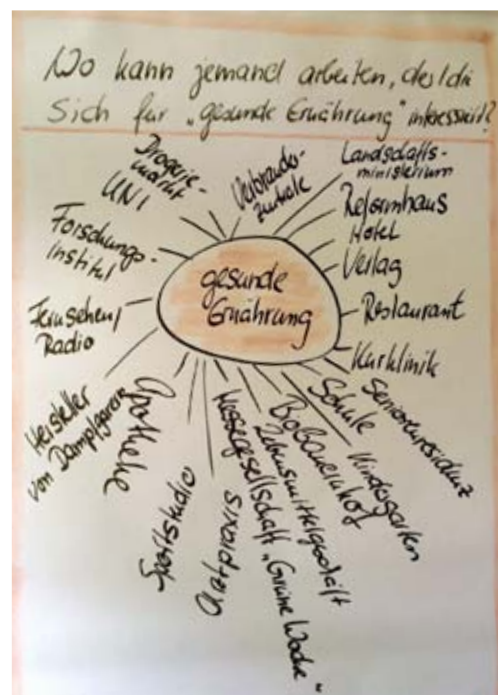
Abb. 4: Interessen explodieren

licher. Das Tun beschreibt die reine Tätigkeit. Das Interesse ist das Thema. Nicht selten beschreibt das vermeintliche Interesse an Menschen nämlich eher einen Wunsch an das berufliche Umfeld, z.B.: Ich möchte gerne im Team arbeiten. Deshalb wird im Beratungsprozess ein deutlicher Fokus auf die Reflexion über ein echtes Interessensgebiet gesetzt. Fragestellungen wie: „Worüber reden sie immer wieder gerne?“ oder „Wozu recherchieren Sie häufig im Internet?“ unterstützen bei der Identifikation eines für die berufliche Entwicklung relevanten Interessensgebietes. Dieses Interesse wird dann in einer weiteren Übung „explodiert“.