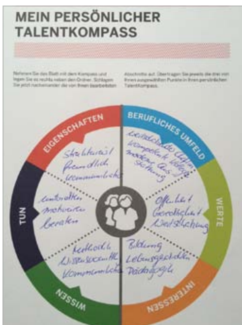
Abb. 2: TalentKompass- Grafik

Kernelement des TalentKompass-Prozesses ist der sogenannte positive Bericht. Die Teilnehmenden erinnern sich an eine private oder berufliche Situation, in der sie vor einer Herausforderung gestanden haben, in der sie aktiv geworden sind, das Handeln trotz gewisser Anstrengungen angenehm war und das Ergebnis ein Positives gewesen ist. Aus diesem in der Regel schriftlich festgehaltenen Bericht analysieren die Erzählenden und die anderen Teilnehmenden auf einem Arbeitsblatt die Fähigkeiten, die sie selbst im eigenen bzw. im Handeln der erzählenden Person gesehen haben. Nacheinander werden die analysierten Fähigkeiten vorgelesen, wobei die Gruppenteilnehmer in der Regel weitaus mehr Fähigkeiten in dem jeweiligen Bericht identifizieren, als die berichtende Person selbst.